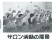
サロン活動の風景